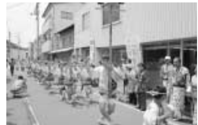
▲片上春まつりの様子

昨年より同好会として活動している備前阿波おどり「かいの木連」が二度目の備前まつりに向け本格的に活動を始めました。練習を始めて半年の昨年とは違い、備前まつりや本場徳島の阿波踊りをはじめ、県内にとどまらずさまざまなイベントに積極的に参加しながら磨き上げてきた踊