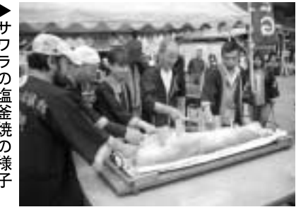
▶サワラの塩釜焼の様子

同青年部では他に地産地消メニューとしてスーベリ話題の塩麴（馬場商店）で味付け、パウダー状にしたサワラの燻製や瀬戸内市産のマッシュルームなどを加えたオリジナルのラーメンの販売も行いました。