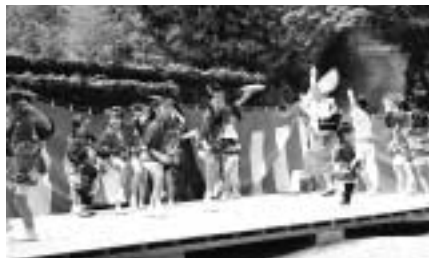
備前商工会議所 ☎六四二二八八五

「かいの木連」では、一緒に楽しく活動できる会員を募集しています。(踊り・男踊り・女踊り 鳴り物・大太鼓・締太鼓・篠笛・三味線・鉦の奏者) 初心者の方大歓迎ですので、ぜひ一度練習を見学にいらしてください!